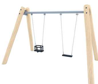
ROBINIA SCHOMMEL, DUBBEL, BABYZITJE & SCHOMMEL BGL8103