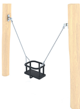
ROBINIA SCHOMMEL, MINI POST, BABYZITJE BGL8101