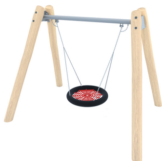
ROBINIA SCHOMMEL, ENKEL, NESTSCHOMMEL BGL8102