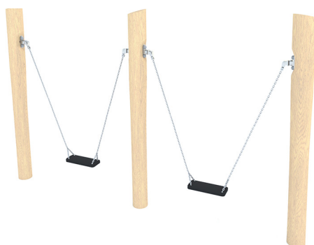
ROBINIA SCHOMMEL, MINI POST, DUBBELE SCHOMMEL BGL8130